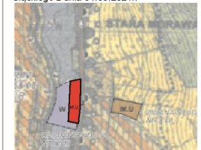
Teren objęty m.p.z.p

Kopia studium uwarunkowań i kierunków zagospodarowania przestrzennego miasta i gminy Stronie Śląskie zatwierdzone uchwałą Nr XXXIII/226/2021 Rady Miejskiej Stronia Śląskiego z dnia 31.03.2021r.