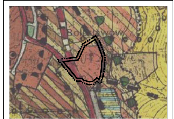
Wyrzys ze Studium Uwarunkowań i Kierunków Zagospodarowania Przestrzennego Miasta i Gminy Stronie Śląskie