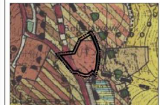
Wzrys ze Studium Uwarunkowań i Kierunków Zagospodarowania Przestrzennego Miasta i Gminy Stronie Śląskie