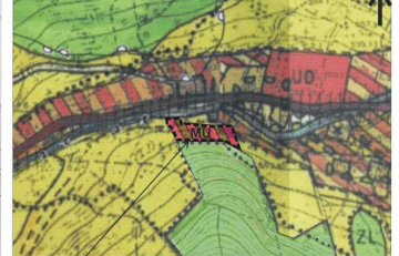
GRANICA ObsZARU ObjĘTEGO PLANEM MiejsCOWYM